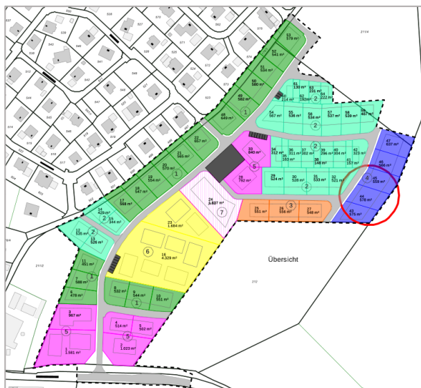
Planauszug. Den Detailplan finden Sie auf unserer Homepage.