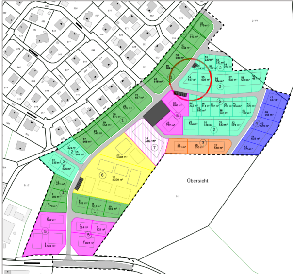
Planauszug. Den Detailplan finden Sie auf unserer Homepage.