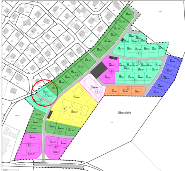
Planauszug. Den Detailplan finden Sie auf unserer Homepage.