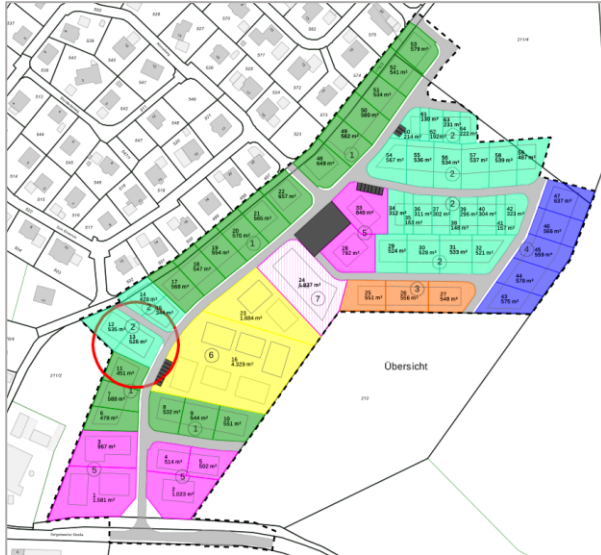
Planauszug. Den Detailplan finden Sie auf unserer Homepage.