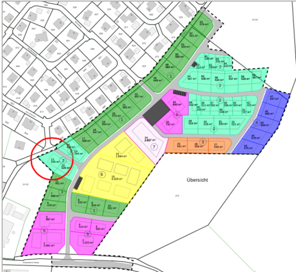
Planauszug. Den Detailplan finden Sie auf unserer Homepage.