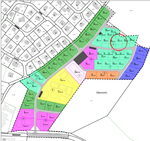
Planauszug. Den Detailplan finden Sie auf unserer Homepage.