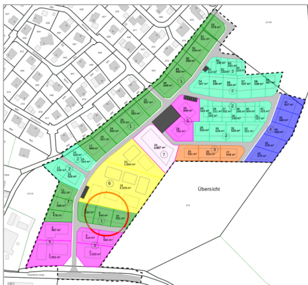
Planauszug. Den Detailplan finden Sie auf unserer Homepage.