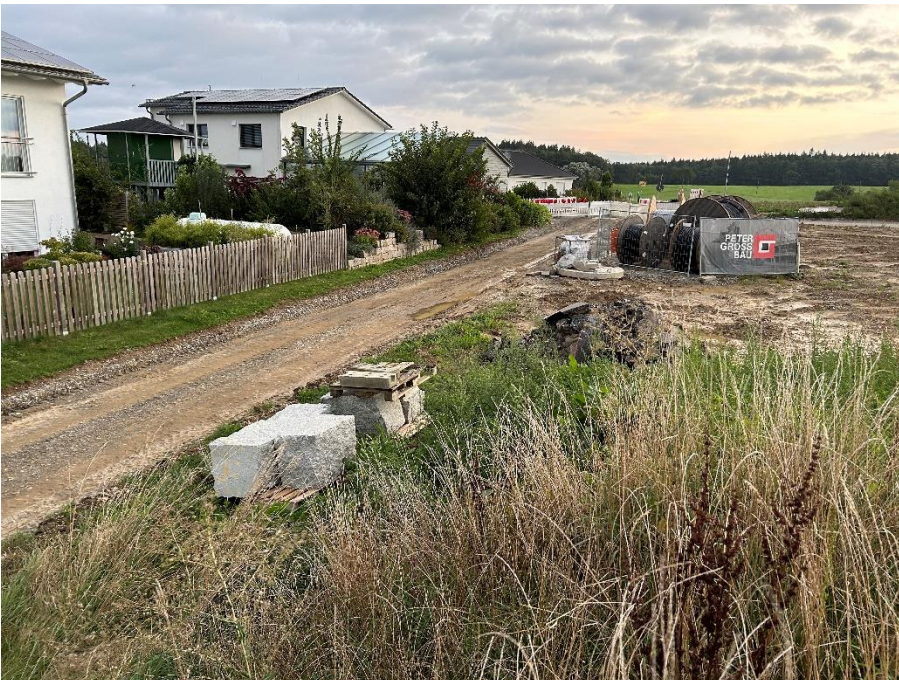
Bild 2: Straßenabschnitt „Am Röschberg“ zwischen den Anliegerstraßen „Römerberg“ und „Am Hart“, Blick in Richtung Norden (11.09.2024)