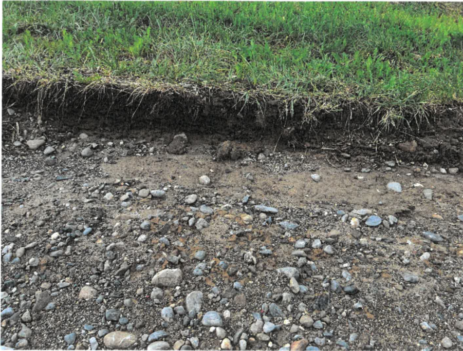
Bild 3: Detailansicht von der Sohle des ehem. Straßenkörpers und dem Anschnitt des gewachsenen Bodens, Blick Richtung Osten (11.09.2024)

Der Rückbau des Straßenabschnitts „Am Röschberg“ zwischen „Am Ehrenloh“ und „Am Hart“ kann auf Grundlage der vor Ort gemachten Beobachtungen vom 11.09.2024 als erfolgreich und vollständig beurteilt werden. Der vorhandene Kies (vgl. Bild 3) stammt größtenteils aus dem im Baufeld natürlich anstehendem Geschiebelehm (Grundmoräne) und stellt keine nachteilige Veränderung des Bodens dar.