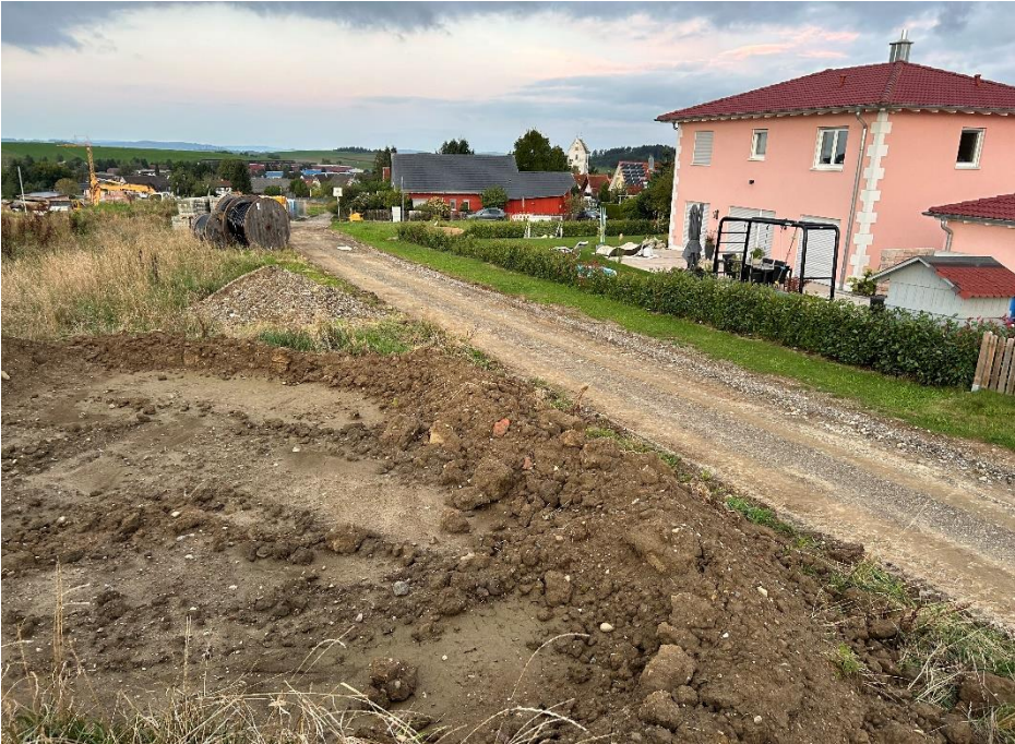
Bild 1: Straßenabschnitt „Am Röschberg“ zwischen den Anliegerstraßen „Am Ehrenloh“ und „Römerberg“, Blick in Richtung Süden (11.09.2024)